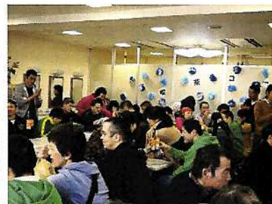
打ち上げ お疲れ様