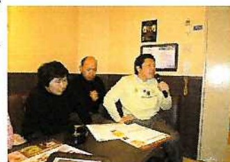
大好きなカラオケ

余暇活動は暮らしの幅を広げ、よい仕事を支え、地域の人とつながる機会を増やします。しいの実社では、土曜開所のプログラムとして取り組み、参加者は少しずつ増えています。社員の多様なニーズに一つのプログラムでは応えられないため、ボランティアさんのサポートもお願いして、地域の資源を利用できる少人数のグループの企画も取り入れています。