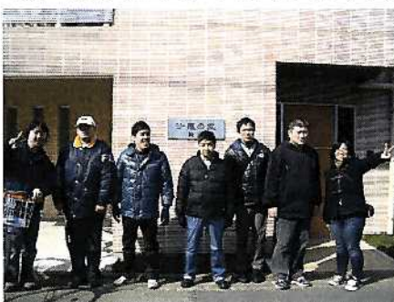
沙羅の家 向原 を出発

今年3月20日の祝日に沙羅の家、沙羅の家 向原合同で目黒川を散歩して中目黒にある「チェルキオ」まで行ってきました。オシャレなレストランで美味しいランチの Pasta やカレーなどを食べ、食後にはチョコケーキやプリンなどのデザートも食べて皆さん大満足だったようです。桜にはまだ早かったですが、天気に恵まれ楽しい祝日が過ごせました。