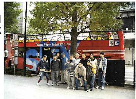
全員集合!! バスの前でパチリ